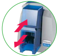
前面フィード、 前面アウトプット機構

プリンタの設置、ドライバのインストールからカードの発行までを簡単操作で行えるシンプルな設計です。設置場所を選ばない、前面フィード、前面アウトプット機構です。