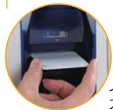
インプットスロット

プリンタ情報を、PC画面と本体のステータスライトでお知らせ。最新ドライバのバージョンアップも、Webから簡単にダウンロードできます。