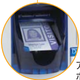
アウトプットホッパー