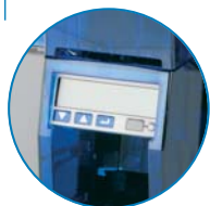
LCDパネルによるステータス表示 (OP)

ネットワークオプション選択時にプリンタ前面に配置されるLCDパネルで、PCを介さずにプリンタのステータスを確認できます。端末でステータスの確認ができて便利です。