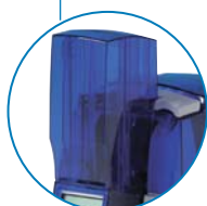
大容量インプット (OP)

スマートカードや磁気ストライプによるエンコーディング、ネットワーク対応インタフェース、高価なブランクICカードの盗難を防ぐサプライロックなど環境に応じて構成できます。